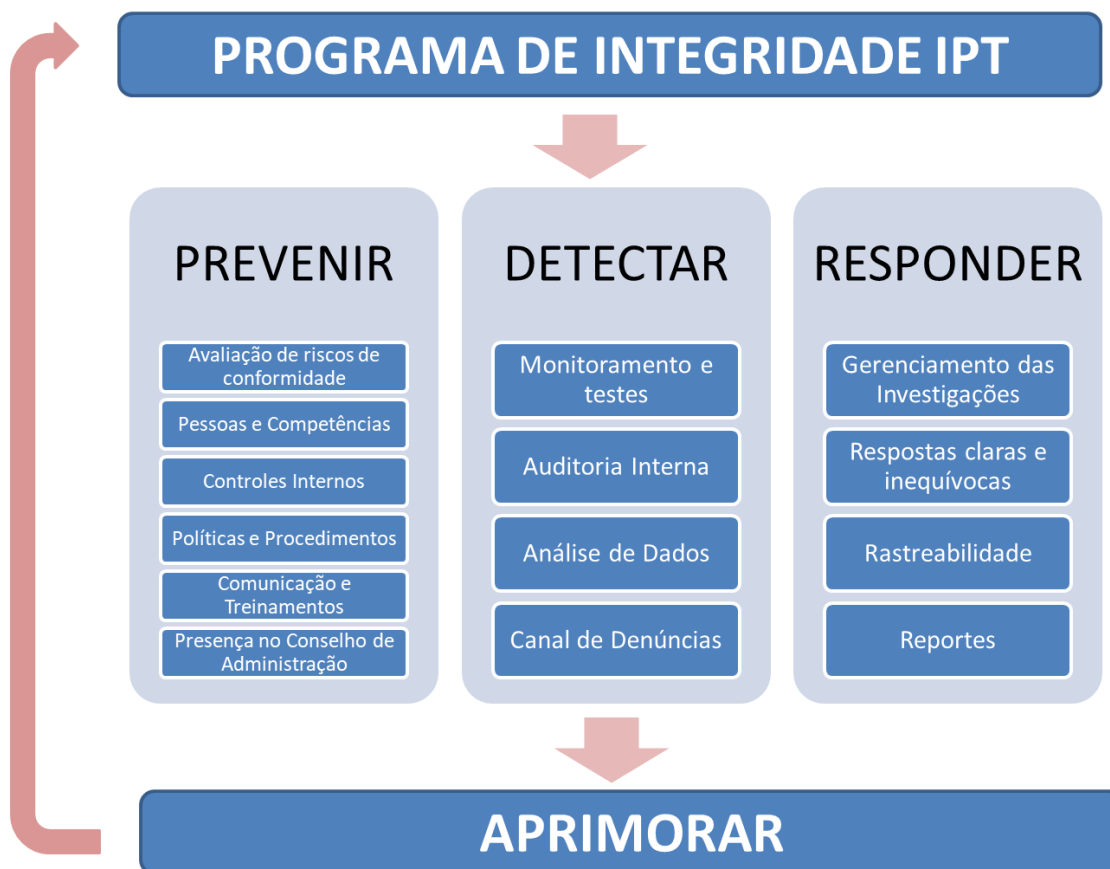
Figura 2 – Melhoria Contínua do Programa de Integridade do IPT