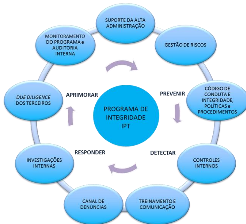
Figura 1 – Estrutura do Programa de Integridade do IPT

O Programa de Integridade está estruturado no desenvolvimento de nove pilares, todos eles imprescindíveis para o alcance dos objetivos propostos, a saber: