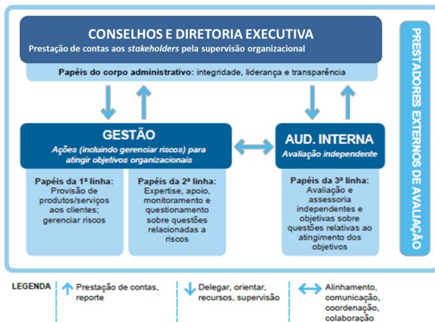
Figura 4- Baseado no Modelo das Três Linhas do The Institute of Internal Auditors : Modelo das Três Linhas do IIA 2020, 2020

Determinando as funções e os deveres de cada área e dos empregados pode-se seguir o modelo das três linhas para a gestão e o controle dos riscos, de forma contínua, conforme o demonstrado a seguir: